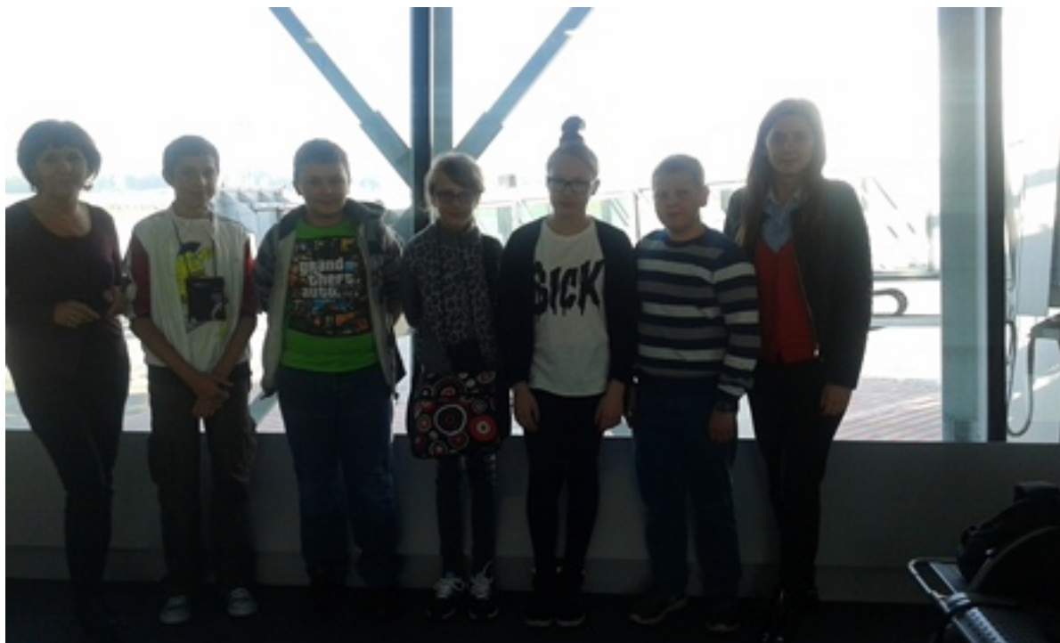
Tuż przed wylotem do Estonii

Spotkanie szkół partnerskich w Estonii to kolejny etap projektu „Rainbow Kids”, mającego na celu naukę tolerancji, poznawanie innych kultur oraz promowanie języka angielskiego jako języka globalnego. Odbyło się ono w dniach 29.09.2014r.-3.10.2014r. Podczas spotkania uczniowie uczestniczyli w międzynarodowych warsztatach, ucząc się piosenek w językach krajów partnerskich. Uczestnicy spotkania poznawali kulturę Estonii podczas koncertów, zwiedzania lokalnych przedsiębiorstw produkujących regionalne produkty, ale również podczas różnorodnych warsztatów w których poznawali inne języki.