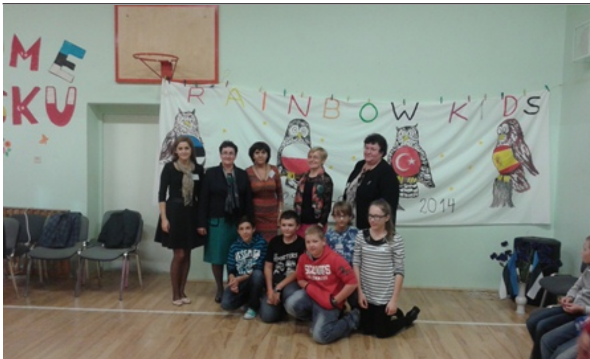
Otwarcie spotkania w szkole Estońskiej